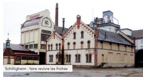
Schiltigheim : faire revivre les friches