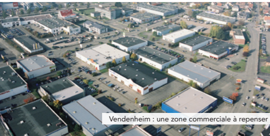
Vendenheim : une zone commerciale à repenser