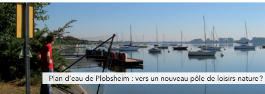
Plan d'eau de Plobsheim : vers un nouveau pôle de loisirs-nature ?