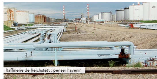
Raffinerie de Reichstett : penser l'avenir