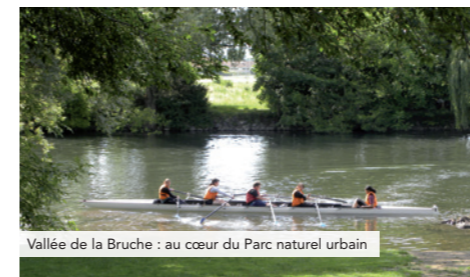
Vallée de la Bruche : au cœur du Parc naturel urbain