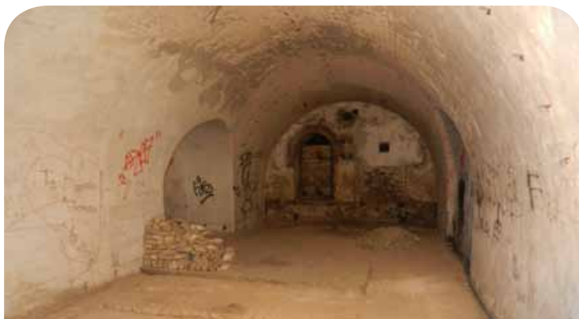
La boulangerie avant et après