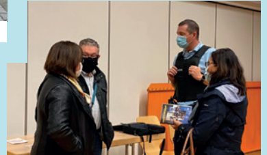
RÉUNION QUARTIER DU NORDFELD SUR LA PARTICIPATION CITOYENNE, 1 ER OCTOBRE