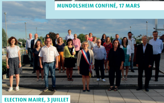
ELECTION MAIRE, 3 JUILLET