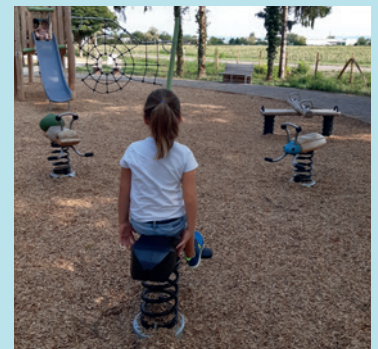
AIRE DE LOISIRS QUARTIER DU PARC, ÉTÉ