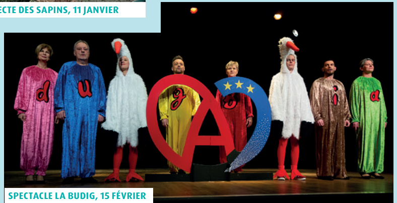
SPECTACLE LA BUDIG, 15 FÉVRIER