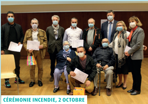
CÉRÉMONIE INCENDIE, 2 OCTOBRE