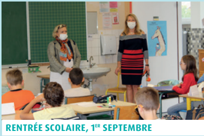
RENTÉE SCOLAIRE, 1 ER SEPTEMBRE