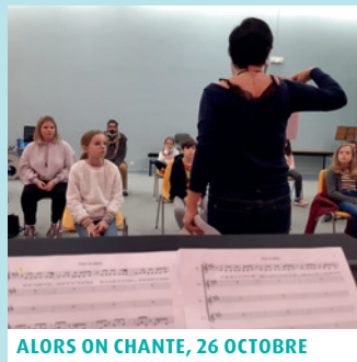
ALORS ON CHANTE, 26 OCTOBRE