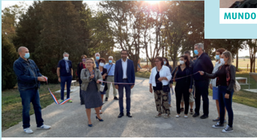
BALADE INAUGURALE DE L'AIRE DE LOISIRS DU QUARTIER DU PARC ET DU PARVIS DE L'ÉGLISE CATHOLIQUE, 19 SEPTEMBRE