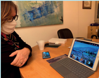
CONCERTATION SUR LE FUTUR SKATE PARK EN VISIO, 12 NOVEMBRE