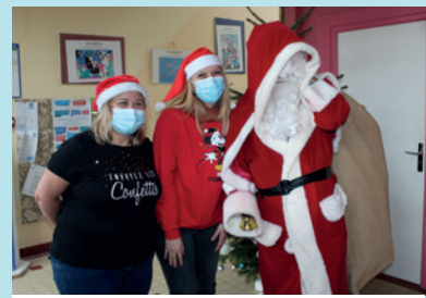
PÈRE NOËL DANS LES ÉCOLES, 17 DÉCEMBRE