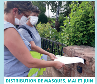
DISTRIBUTION DE MASQUES, MAI ET JUIN