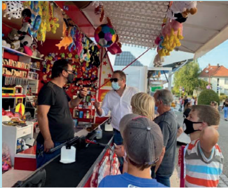
MUNDO EN FÊTE, 12 ET 13 SEPTEMBRE