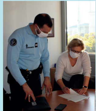
SIGNATURE DE LA CONVENTION « VOISINS VIGILANTS », 9 NOVEMBRE