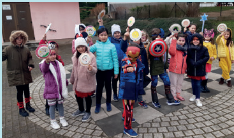
CARNAVAL DU SERVICE ENFANCE, 25 FÉVRIER