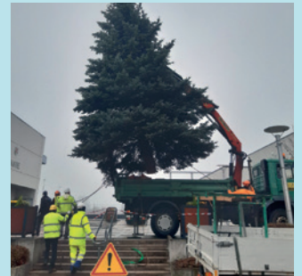
MISE EN PLACE DU SAPIN DE NOËL SUR LE PARVIS DE LA MAIRIE, NOVEMBRE