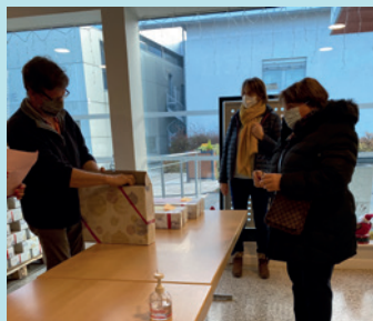
REMISE DU COLIS AINÉS, 5 DÉCEMBRE