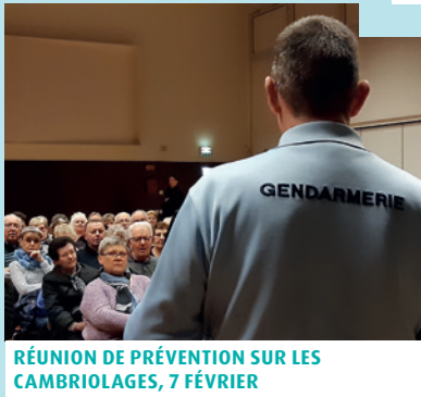
RÉUNION DE PRÉVENTION SUR LES CAMBRIOLAGES, 7 FÉVRIER