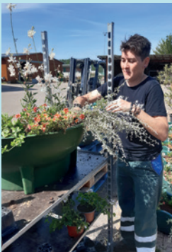
FLEURISSEMENT DE LA COMMUNE, MAI