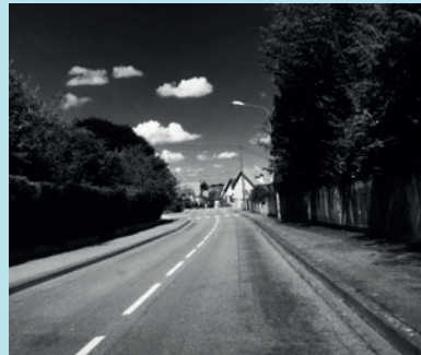
MUNDOLSHEIM CONFINÉ, 17 MARS