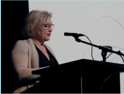
VŒUX DU MAIRE, 10 JANVIER

Revivez en images les événements qui ont animé Mundolsheim en cette année 2020 si particulière