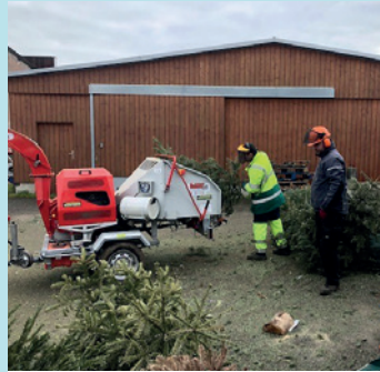
COLLECTE DES SAPINS, 11 JANVIER