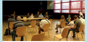
RENCONTRE AVEC LES HABITANTS DU QUARTIER DU CLIMONT, 17 SEPTEMBRE