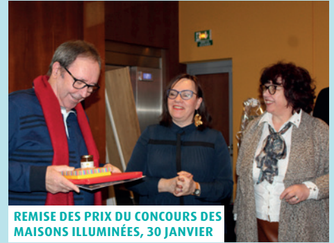
REMISE DES PRIX DU CONCOURS DES MAISONS ILLUMINÉES, 30 JANVIER