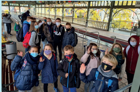
LA MAISON DES JEUNES À EUROPAPARK, OCTOBRE