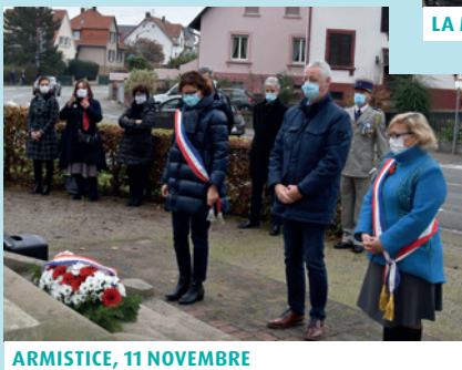
ARMISTICE, 11 NOVEMBRE