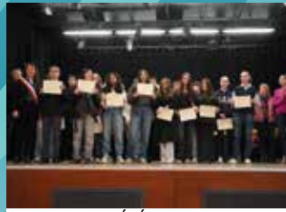
18 JANVIER : CÉRÉMONIE DE REMISE DES BREVETS DES COLLÈGES 2024