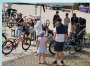
17 MAI : FÊTE DU VÉLO