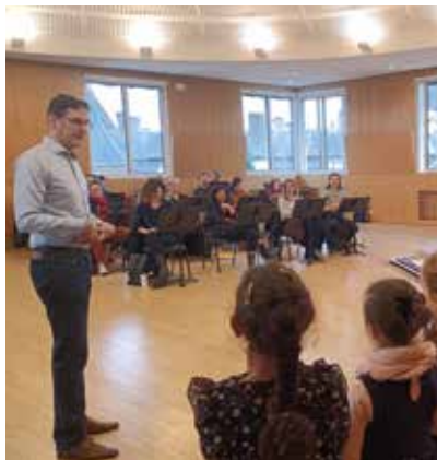
Les choristes à la rencontre des voix lyriques

Au programme de nos rencontres inattendues, nos expéditions strasbourgeoises ont permis à nos jeunes choristes de découvrir avec enthousiasme l'Opéra National du Rhin. Assister à une répétition générale au premier balcon avec vue sur l'orchestre ou pour les plus jeunes, découvrir les voix lyriques lors d'une séance ludique et participative leur ont procuré le sentiment de vivre un moment exceptionnel et réjouissant !