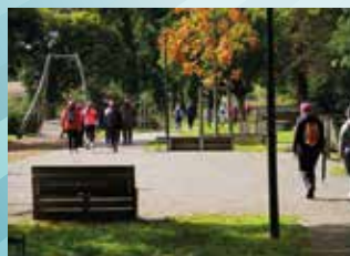
5 OCTOBRE : LA MUNDOLSHEIMOISE