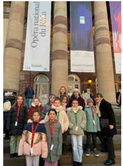
Les choristes à l'Opéra National du Rhin pour une représentation de Hansel et Gretel

Notre année de découverte et de rencontres créatives dédiée à la musique du XX e siècle se poursuit autour de projets pédagogiques où les professeurs accompagnent leurs élèves dans leurs apprentissages et leur progression. Et c'est toujours avec un réel plaisir que nous vous accueillerons tout au long de notre programmation pour vous présenter notre travail et partager un beau moment de musique ! ●