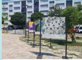
JUIN : EXPOSITION SUR LA BIODIVERSITÉ