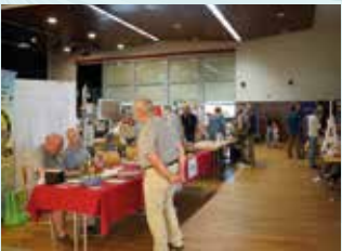
30 AOÛT : FESTI'FORUM DES ENTREPRISES ET DES ASSOCIATIONS