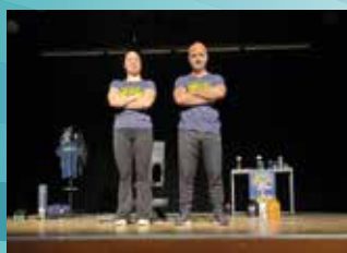
26 AVRIL : SPECTACLE RUNNING, CROSSFIT ET MOJITO