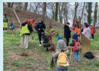
26 MARS : PLANTATION D'ARBRES AU FORT DUCROT