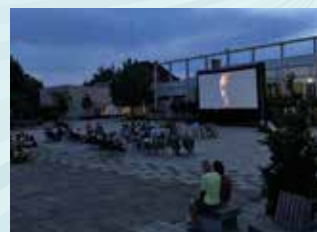
5 JUILLET : CINÉMA PLEIN AIR