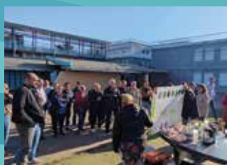
5 AVRIL : CAFÉ AVEC LE MAIRE