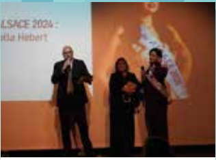
10 JANVIER : VŒUX DU MAIRE