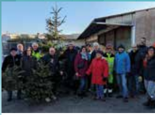
11 JANVIER : COLLECTE DES SAPINS DE NOËL