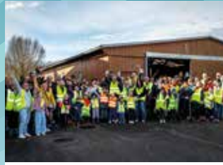
22 MARS : OSTERPUTZ