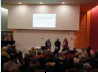
15 MARS : CONFÉRENCE SUR LA CATHÉDRALE DE STRASBOURG