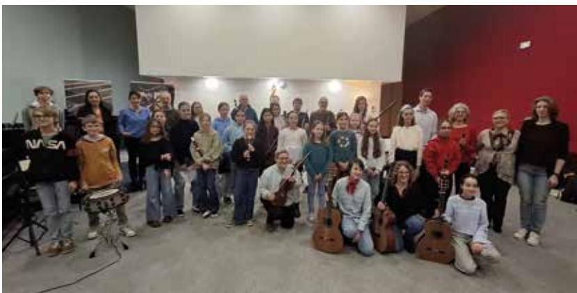
Concert du 17 janvier dédié à Béla Bartók

Notre année de découverte et de rencontres créatives dédiée à la musique du XX e siècle se poursuit autour de projets pédagogiques où les professeurs accompagnent leurs élèves dans leurs apprentissages et leur progression. Et c'est toujours avec un réel plaisir que nous vous accueillerons tout au long de notre programmation pour vous présenter notre travail et partager un beau moment de musique ! ●