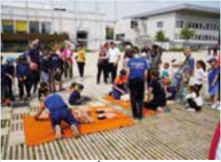
24 MAI : JOURNÉE CITOYENNE