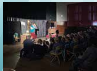
10 DÉCEMBRE : SPECTACLE LA VIEILLE BOITE DE MONSIEUR WALTER