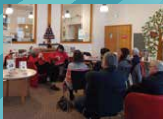
6 DÉCEMBRE : CONFÉRENCE ALSACE GOURMANDE