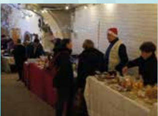
13 ET 14 DÉCEMBRE : MARCHÉ DE NOËL

(Re)vivez ces événements en vidéo sur notre chaîne youtube