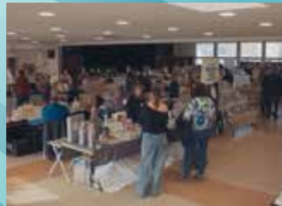
9 NOVEMBRE : LE RENDEZ-VOUS DES ARTISANS-CRÉATEURS