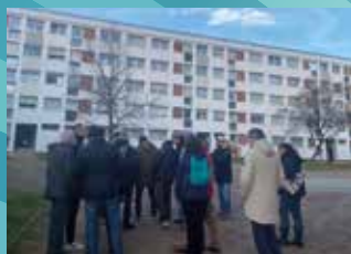
8 FÉVRIER : BALADE THERMOGRAPHIQUE