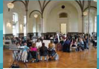
4 JUIN : CONVENTION DU PERSONNEL