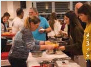
7 NOVEMBRE : SOIRÉE MOULES-FRITES