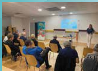
SEPTEMBRE-OCTOBRE : MOIS DE L'EFFICACITÉ ÉNERGÉTIQUE R-GDS