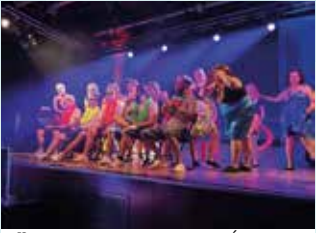
1 ER MARS : ATTENTION AU DÉPART DE LA COMPAGNIE COUP D'ŒUR