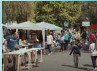
13 ET 14 SEPTEMBRE : MUNDO EN FÊTE ET VIDE GRENIER