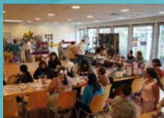
27 SEPTEMBRE : MUNDO POP