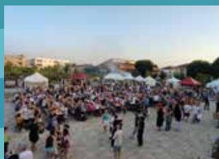
14 JUIN : FÊTE DE L'ÉTÉ