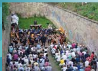
21 JUIN : CONCERT DE L'ORCHESTRE DES JEUNES DE STRASBOURG