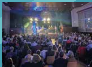
15 NOVEMBRE : CONCERT FOES CHANTE GOLDMAN