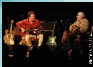
8 FÉVRIER : LA NUIT DE LA GUITARE