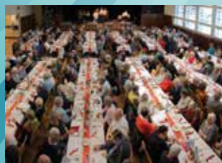
7 DÉCEMBRE : FÊTE DE NOËL DES AINÉS