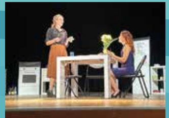
20 SEPTEMBRE : SPECTACLE CUISINE ET DÉPENDANCES