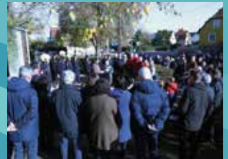
11 NOVEMBRE : CÉRÉMONIE DE L'ARMISTICE