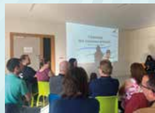
11 OCTOBRE : CÉRÉMONIE DES NOUVEAUX ARRIVANTS