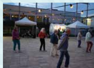
17 MAI : BAL MUSETTE