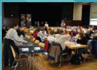
1 ER FÉVRIER : MUNDOLUDIQUE