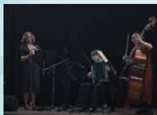
28 JUIN : CONCERT TANGO PASSION DU TRIO ELRIMA