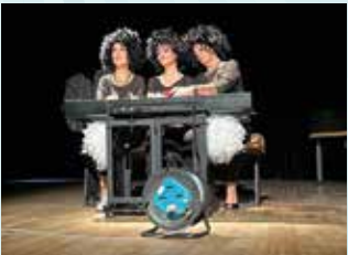
18 OCTOBRE : SPECTACLE LE PHOENIX DE CES DAMES